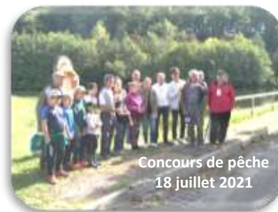
Concours de pêche 18 juillet 2021

Coût de tous ces aménagements : 43 260 € . Nous avons d'ores et déjà obtenu une aide de 5 095 € du Conseil Départemental, en attente des autres financeurs.