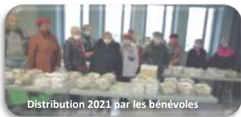
Distribution 2021 par les bénévoles