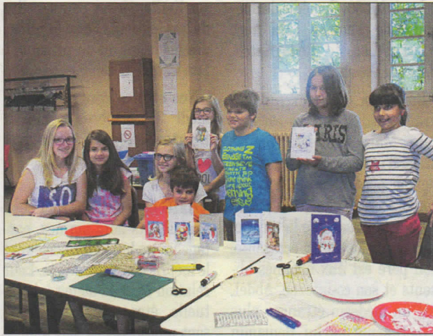
Un après-midi créatif apprécié de tous.

Les mamans ont eu aussi bien du plaisir à réaliser leur carte. Les enfants se sont montrés si assidus qu'ils n'ont pas eu le temps de jouer comme