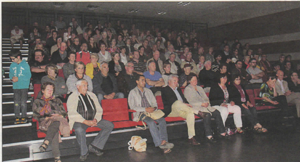
Un public venu très nombreux ce soir-là au Nayrac.

pace multiculturel du Nayrac pour une soirée à la rencontre de Beethoven et Mozart. Informations, réservations et pré-ventes des billets à la Maison de la Presse d'Espalion au 05.65.44.06.08 ou à l'office de tourisme au 05.65.44.03.22.