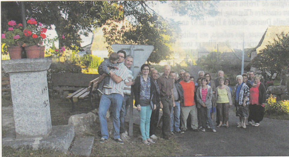
Habitants et élus sur la place de Bouldoires.

Samedi 27 septembre, les élus et les habitants de Bouldoires se sont retrouvés sur la place de Bouldoires. Ce hameau situé au nord de la commune avec son puech à 856 m d'altitude a subi un coup de jeune ces dernières années. Avant, il y avait surtout des fermes, une école fermée en 1979, un dancing très célèbre dans les années 1968, une vingtaine de maisons en tout. Aujourd'hui, seulement deux fermes mais des habitations ré-