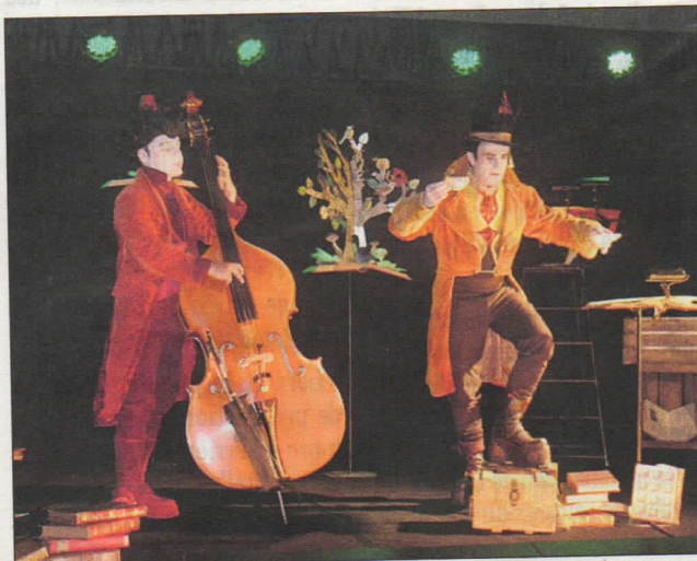
Des personnages farfelus.

Ce conte musical, mettant en scène les personnages comme le lapin blanc, le chapelier fou, la reine de cœur et quelques autres tout aussi farfelus, a séduit les spectateurs, tant les enfants que leurs familles. A l'issue du spectacle, les comé-