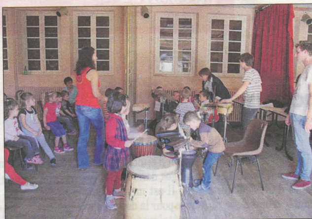
Atelier percussions pour les petits.