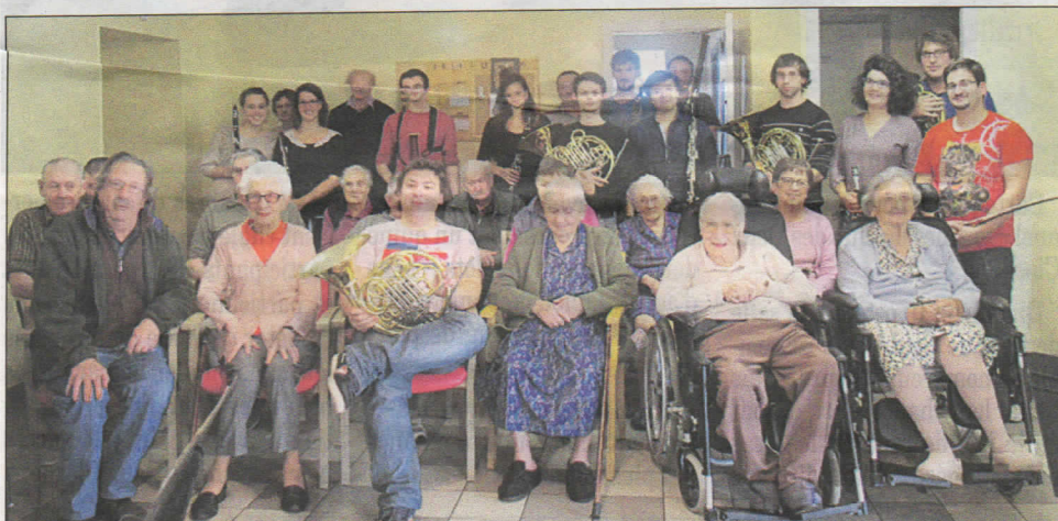
Les résidents en compagnie du groupe des musiciens.

Mercredi 15 octobre, les résidents de l'Unité de Vie ont accueilli un groupe de musiciens dans le cadre de la saison musicale du Vieux-Palais. Les différents instruments, cla-