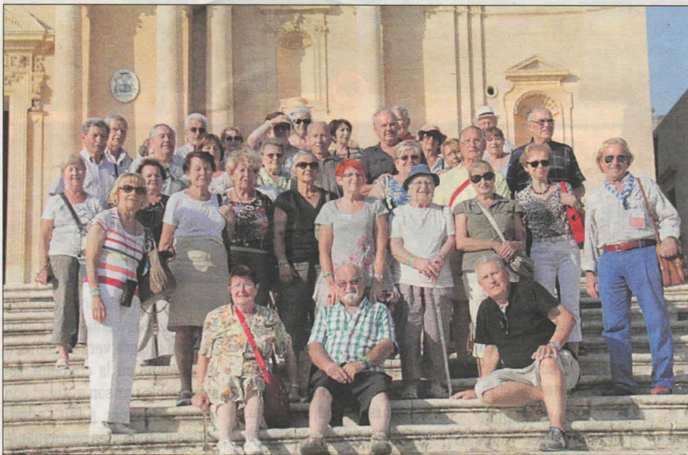
Les participants découvrent les merveilles de la Sicile.

C'est la Sicile que les membres du groupe Aubrac Voyages étaient invités à visiter en ce début d'automne.