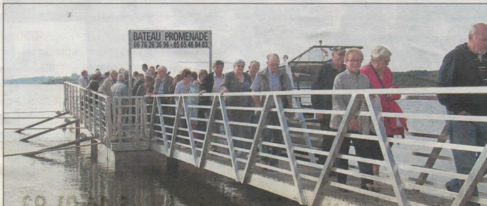
Retour d'une belle balade sur l'eau.