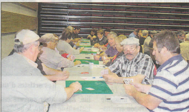
Autour du tapis vert

A l'issue de la soirée, les résultats étaient proclamés et les gagnants se partageaient de jolis lots, non sans avoir dégusté les nombreuses et appétissantes pâtisseries préparées par les parents d'élèves. Les cinq premières équipes sont :