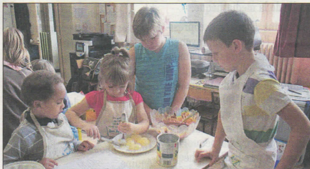
Les enfants étaient très appliqués dans la préparation des desserts.

Les quantités indiquées ne correspondaient pas toujours à celles des emballages, alors il a fallu mesurer, peser pour réussir la préparation ! Grâce à l'attention de chacun et des