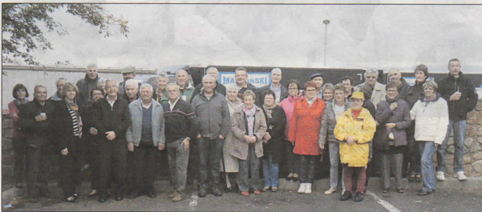
Les participants à Vulcania.

Dimanche 5 octobre, le club de la Pétanque nayracoise conviait joueurs et membres bienfaiteurs à son voyage organisé cette année au cœur des volcans d'Auvergne, à Vulcania.