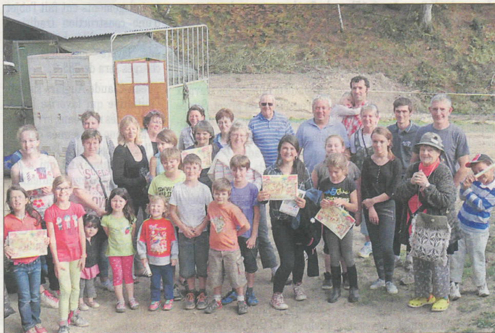
Le groupe au centre équestre «Laguiolle équitation».

Le groupe de danses folkloriques «Les petites fleurs du Nayrac» avait choisi Le Bousquet, près de Laguiolle, pour sa journée détente.