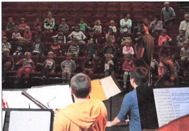
Les musiciens ont fait découvrir leurs instruments à vent.

De la pédagogie ludique appréciée des élèves et des jeunes musiciens qui avaient soif de faire partager leur passion, qui montre