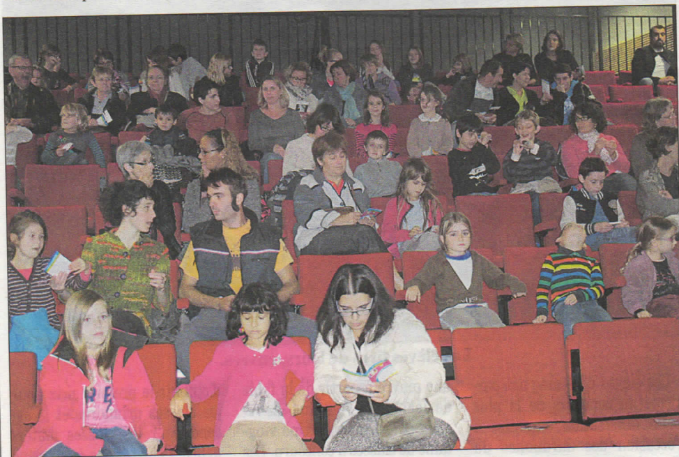
Petits et grands ont apprécié le spectacle.

diens ont quitté la scène et ont rejoint les participants pour discuter et partager les pâtisseries offertes par les parents d'élèves de l'école et les boissons offertes par le foyer rural.