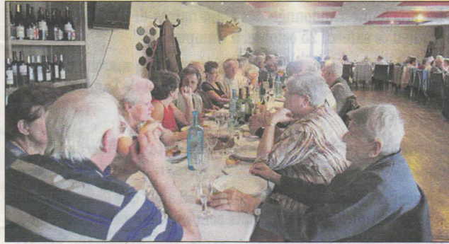
Les adhérents autour d'un bon repas.

Le bureau a été reconduit et les prochaines manifestations annoncées comme les rencon-