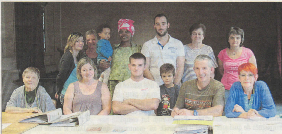
Les membres de l'association en assemblée générale.

Samedi 20 septembre, le foyer rural tenait son assemblée générale à la salle communale.