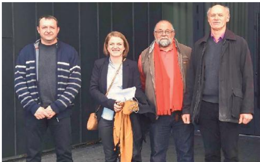
Rencontre avec les élus du Nayrac.

Des rencontres qui vont lui permettre de construire un projet qui prendra en compte les réalités du territoire.