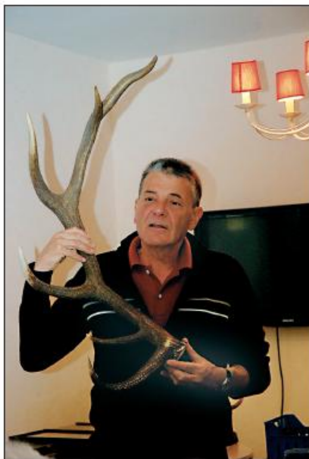
Un magnifique bois de cerf.

Chaque fois un goûter a été partagé entre les visiteurs et les résidents.