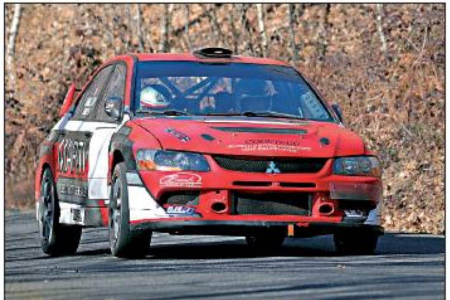
Philippe Alauzet sur le circuit.

Après les mois de décembre et janvier qui ont été plus calmes, la fréquentation a repris avec plusieurs voitures par semaine à la base d'essais. Les pilotes viennent pour découvrir leurs nouvelles autos ou faire des essais ou réglages avant de commencer leur saison de rallyes. En effet, cette portion au parcours varié (rapide, lent, bosselé, virages lents, virages rapides, freinages,...) leur permet de tester leur voiture sur plusieurs configurations de routes qu'ils rencontreront pendant les rallyes. Les derniers travaux réalisés par les bénévoles de l'ARSA ont permis d'élargir une zone pour la rendre un peu plus rapide, à la demande de certains utilisateurs. Un stand couvert est à