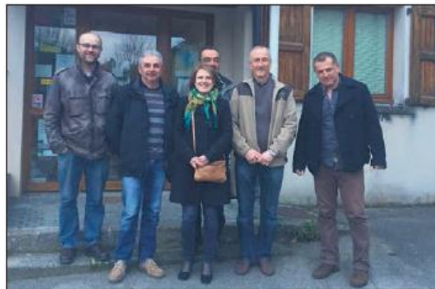
Rencontre avec les élus d'Espeyrac.

trouve ce dynamisme du côté des entrepreneurs comme du côté des élus ou des associations qui sont profondément attachés à l'Aveyron et à son développement. Le rôle du futur député