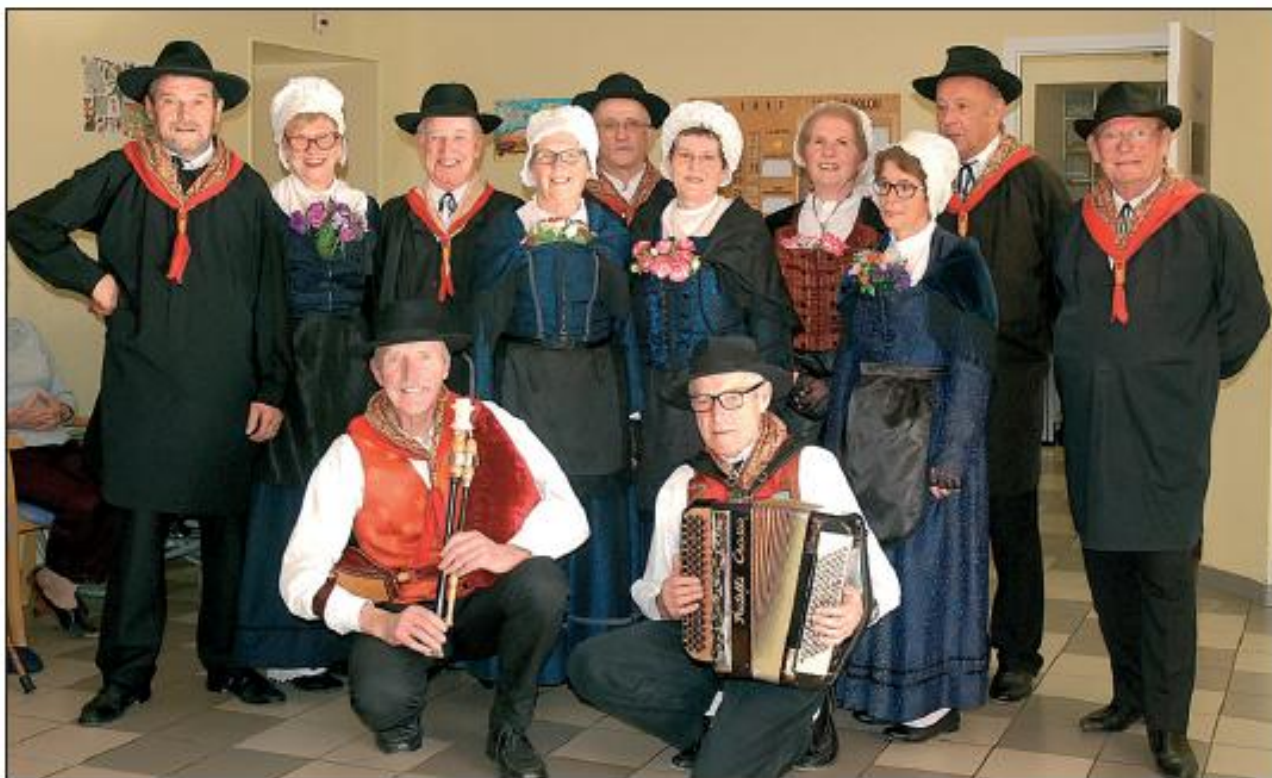
Le groupe de la Barrézienne