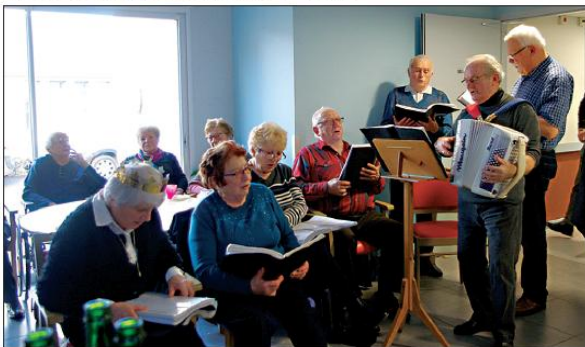
La chorale des Ondes.

Après le partage des galettes offertes par le restaurant Anglade, les chanteurs de la chorale des Ondes et son accordéoniste, venus bénévolement, ont poursuivi l'après-midi avec des airs connus de tous.