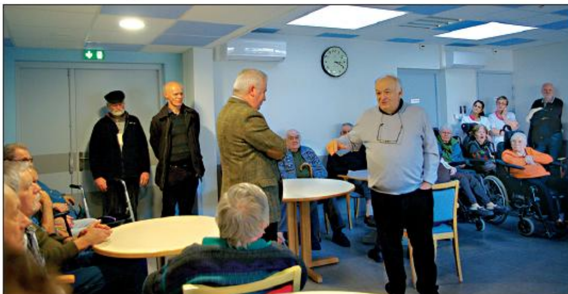
Présentation des vœux.

Janvier est traditionnellement la période des vœux. Il en a été ainsi à l'Unité de Vie La Bellangerie où les résidents, leurs familles, leur amis, les membres du conseil d'administration et les employés se sont retrouvés pour une sympathique rencontre.