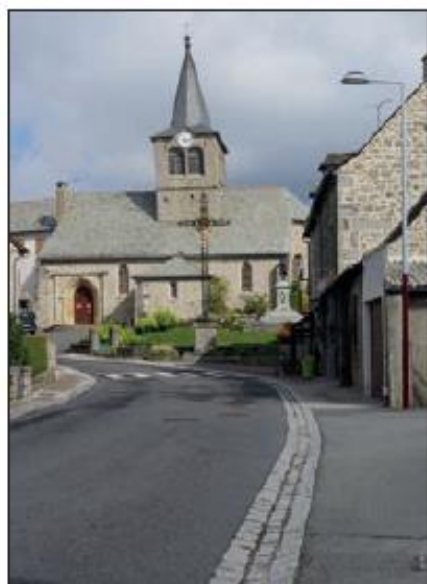
La rue principale est déserte.

Au Nayrac, comme partout, la vie s'organise. Les bars et restaurants ont appliqué les mesures de fermeture, dès le samedi 14 mars au soir, mais les commerces de première nécessité restent accessibles