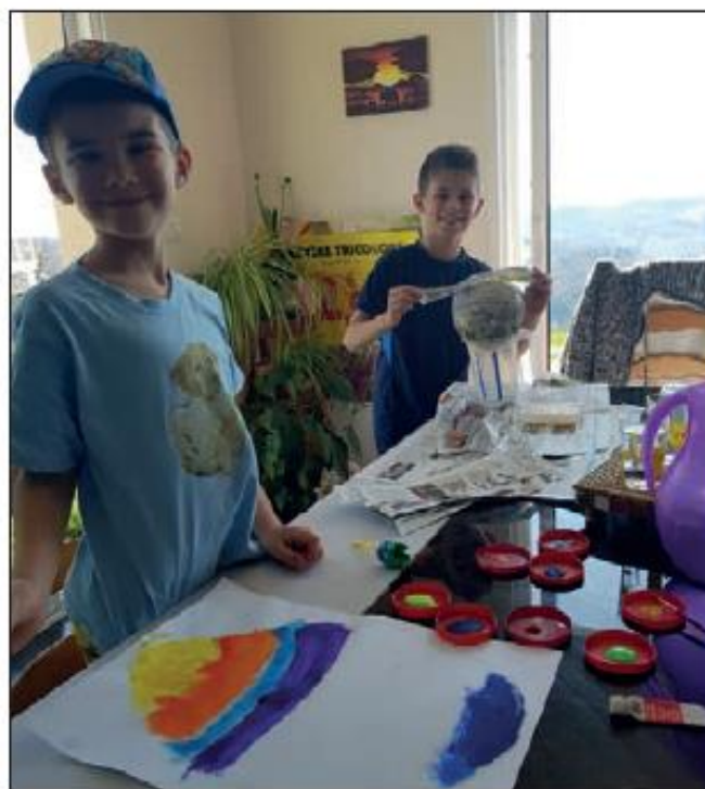
Le salon est transformé en atelier.

Ainsi, les parents reçoivent le plan de travail pour deux jours avec des révisions de maths, de français. Des arts plastiques sont proposés avec du matériel de récupération et les cuisines ou salons sont transformés en ateliers pour le plus grand plaisir des enfants. Les parents sont mobilisés bien que certains continuent de travailler à l'extérieur ou en télétravail chez eux.