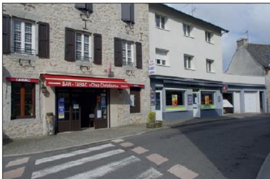
Le bureau de tabac et l'épicerie boulangerie.

Ainsi l'épicerie-boulangerie de Corine est ouverte tous les matins de la semaine et les