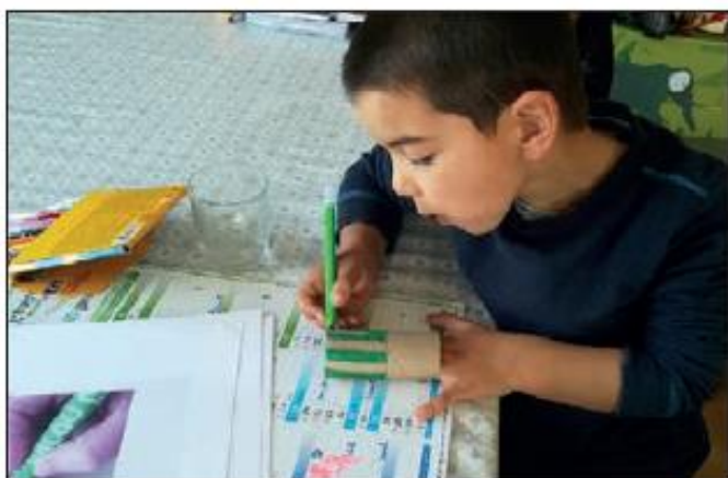
Travail appliqué pour les arts plastiques.

Dès l'annonce de la fermeture des écoles le jeudi 12 mars pour le lundi 16, l'organisation s'est très vite mise en place. Les enseignantes sont venues à l'école le premier jour et ont lancé les programmes.