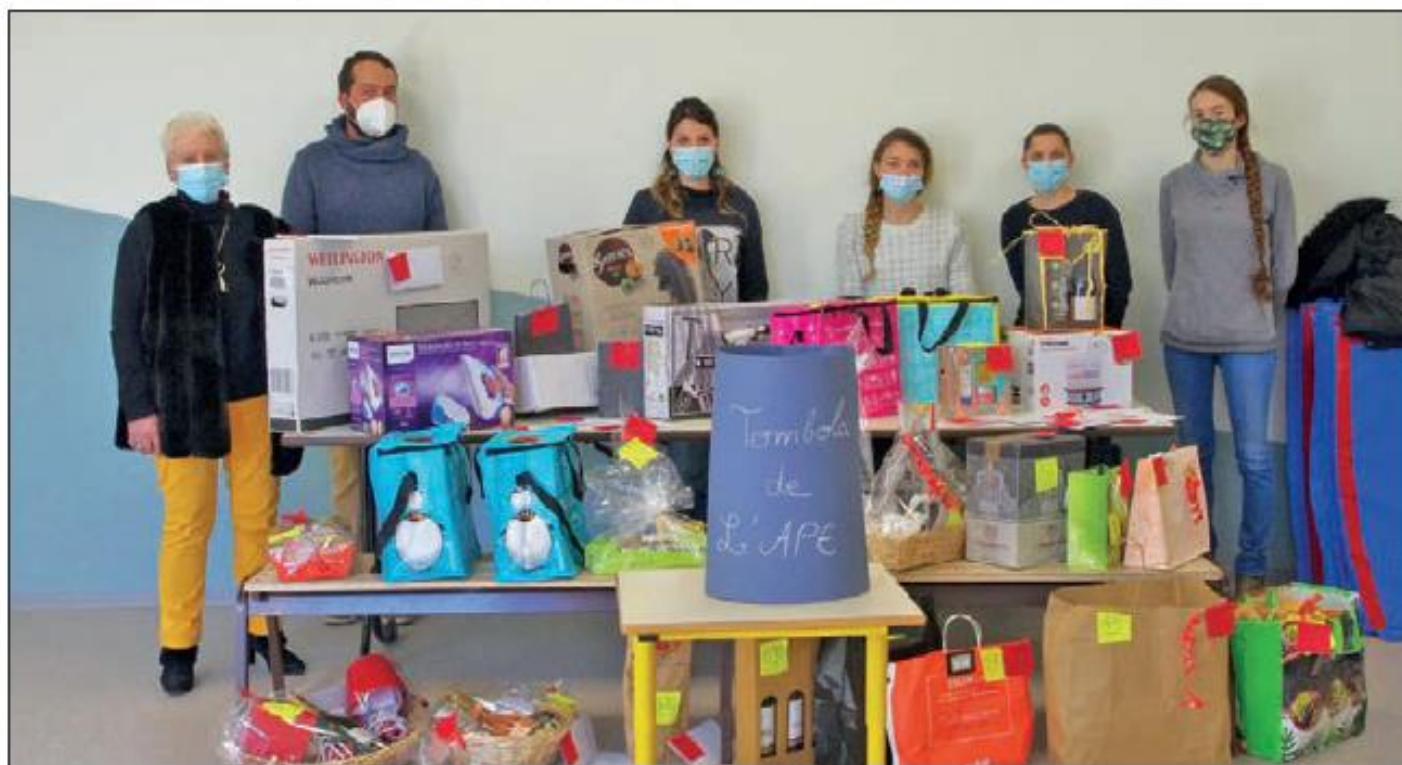
De nombreux lots étaient en jeu.

L'APE prépare sa prochaine manifestation : la vente de fleurs et de plants potagers le dimanche 16 mai de 9h à 12h. Celle-ci se fera uniquement sur commande à récupérer en drive à l'espace multiculturel. Des bons bien documentés sont disponibles auprès des commerçants nayracois ou des élèves.