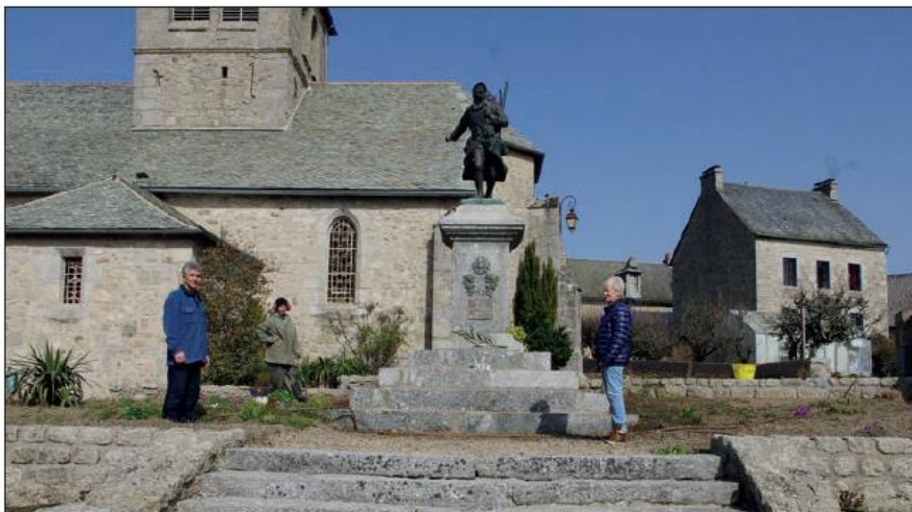
Le monument aux morts et ses abords ont été nettoyés.

De quoi donner un nouveau coup d'œil au centre du village.