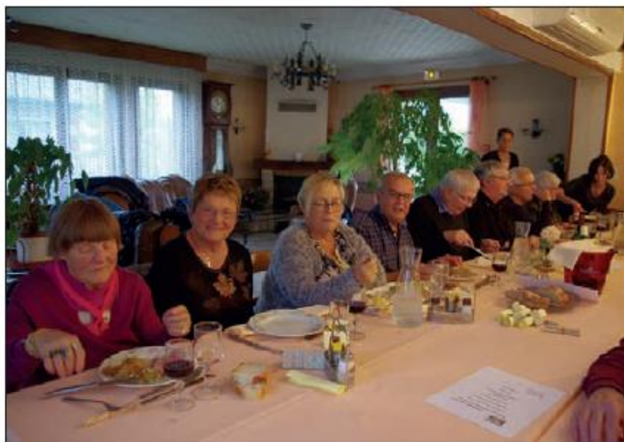
Un bon repas avant la pandémie.

Les nouveaux adhérents sont les bienvenus. Contacts: