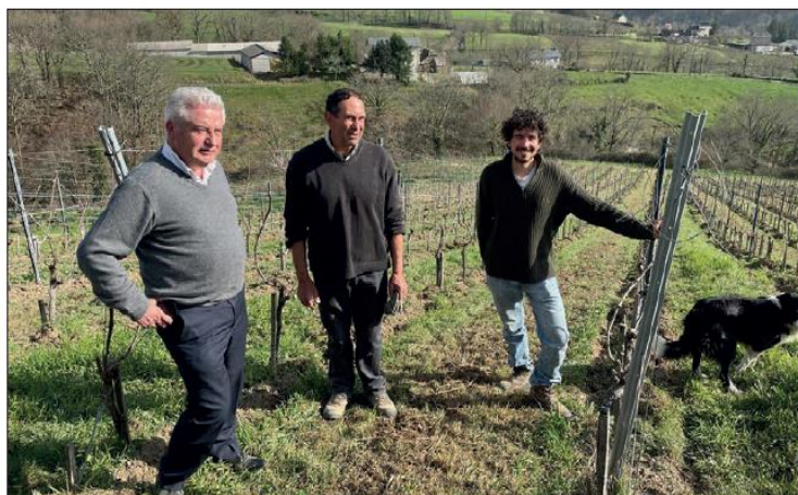
Au Domaine Mousset à Entraygues.