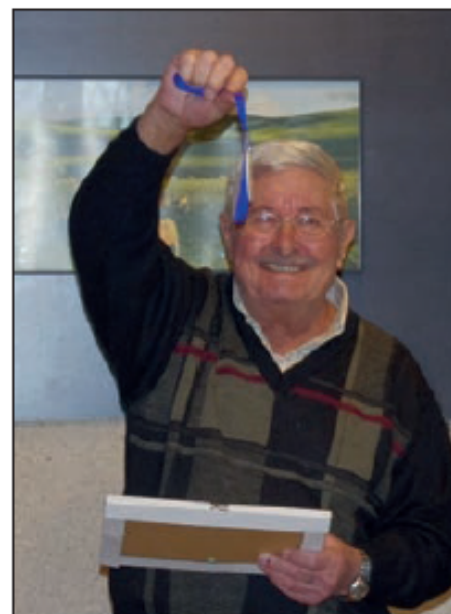
Fier de sa médaille.

Tu aurais voulu participer aux 25 ans du club, mais la pandémie actuelle nous a empêchés d'organiser cette animation.