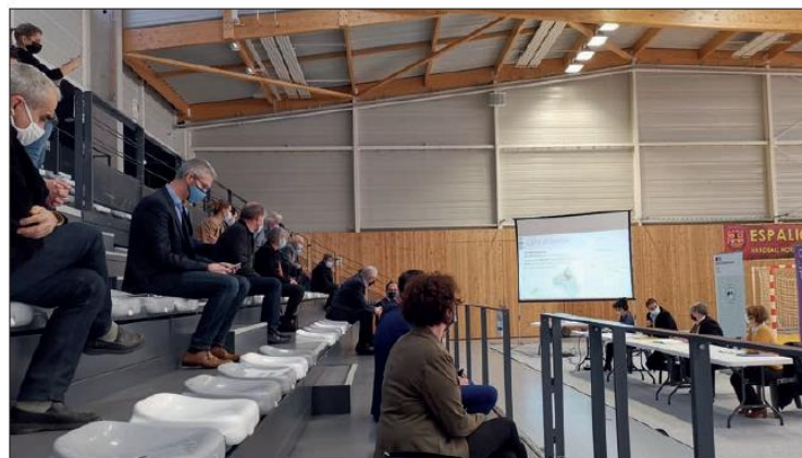
Rencontre avec les maires et les parlementaires.

Enfin, la préfète a conclu la séance en exposant les plans de relance de l'Etat que les collectivités ont su mobiliser pour mener à bien leurs projets. Elle a également assuré tout son soutien à nos communes rurales et à ce territoire entre Comtal, Lot et Truyère qui ne manque pas de ressources et de dynamisme.