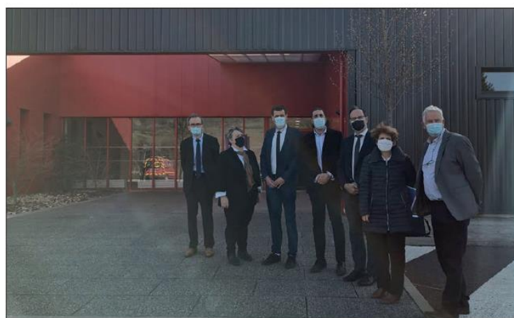
Au complexe sportif intercommunal d'Espalion.