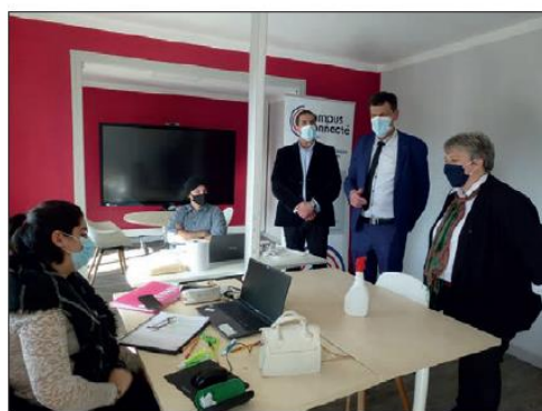
Au Campus connecté.

la qualité de l'équipement, le dimensionnement et la diversité des activités pouvant y être accueillies contribuent à renforcer l'attractivité du territoire. Il constitue un outil complémentaire au service des établissements scolaires et participe au rayonnement du territoire.