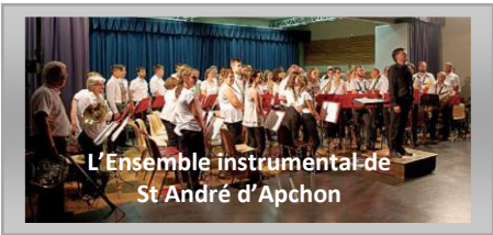
L'Ensemble instrumental de St André d'Apchon