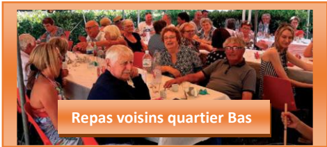
Repas voisins quartier Bas