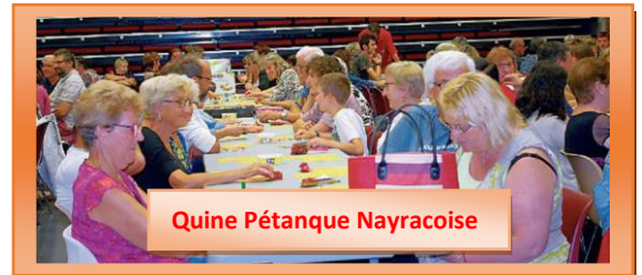
Quine Pétanque Nayracoise