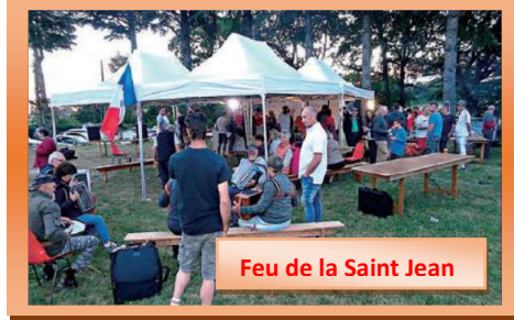
Feu de la Saint Jean