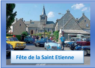
Fête de la Saint Etienne