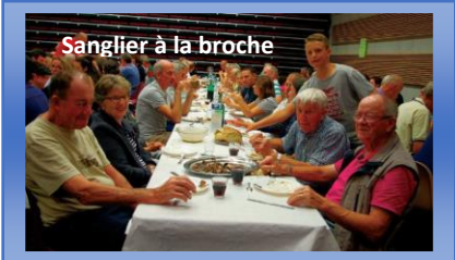
Sanglier à la broche