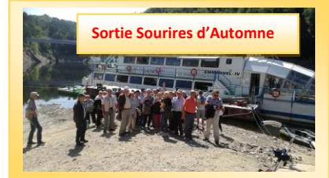
Sortie Sourires d'Automne

Plaquette réalisée par La commission Communale de Communication