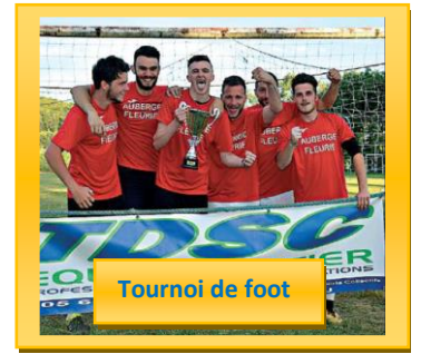
Tournoi de foot