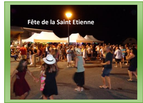
Fête de la Saint Etienne