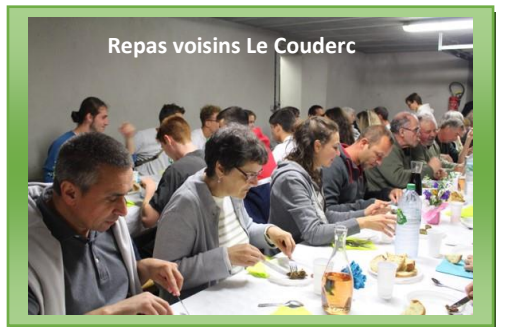
Repas voisins Le Couderc