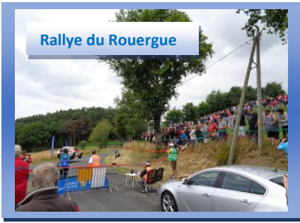
Rallye du Rouergue

Grâce à tous les bénévoles des associations, et aux initiatives des hameaux, notre village fut très animé, voici quelques photos souvenirs.... Merci à tous