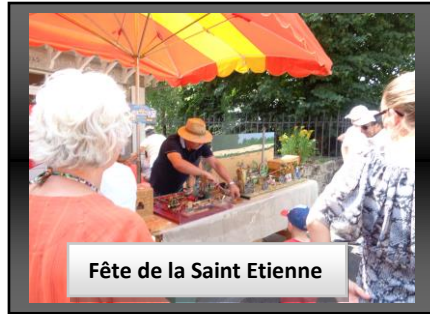
Fête de la Saint Etienne