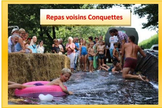
Repas voisins Conquettes