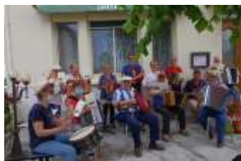
Animations des cafés par les Musiciens du Nayrac