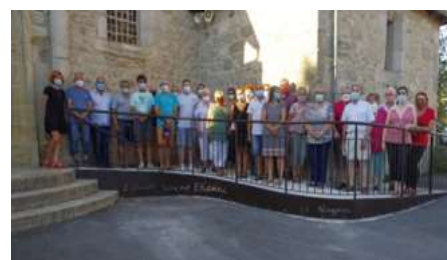
Rencontre avec l'Amicale des Enfants du Nayrac à Paris et les Associations du Nayrac le 7 août