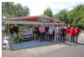
Rencontre à la base d'essais