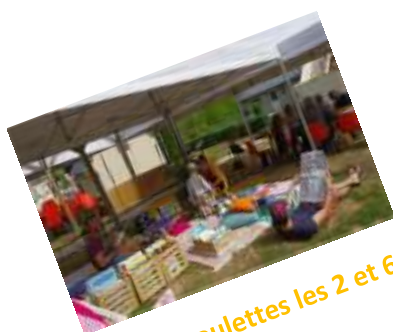
Salon à roulettes les 2 et 6 août