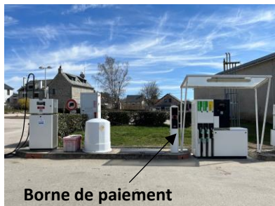
Borne de paiement

Coût des Travaux : 40 222 € H.T. Subventions Etat (DETR) 6 182 € ; Département 6 182 €.