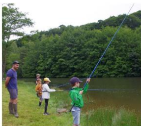
Découverte de la pêche