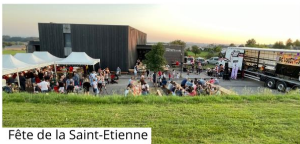
Fête de la Saint-Etienne