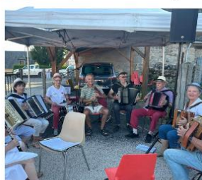
Musiciens du Nayrac