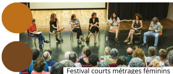
Festival courts métrages féminins