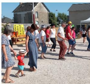
Fête de la Saint-Etienne