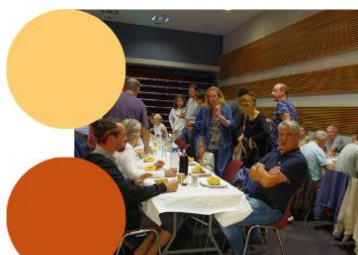
Sanglier à la broche