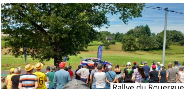
Rallye du Rouergue