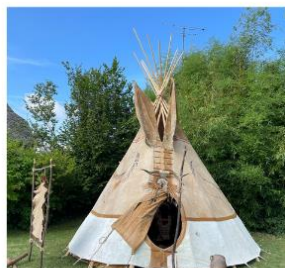
Fête de la Saint-Etienne