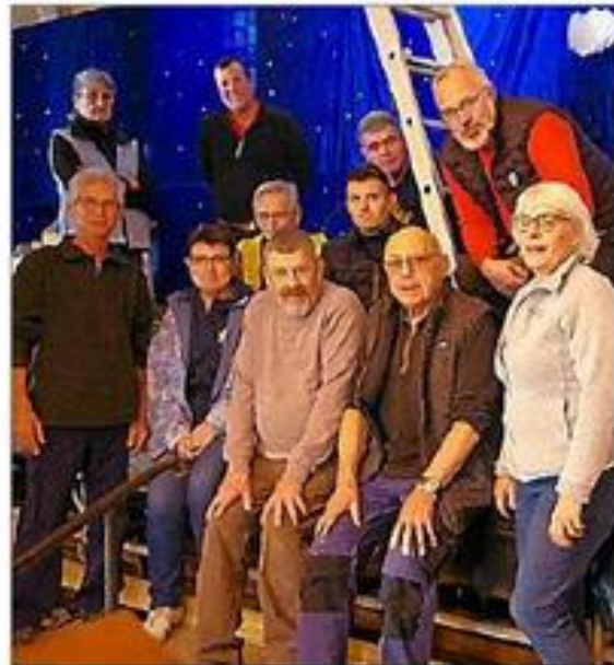
Les bénévoles travaillent pour le village de Noël.

En poussant la porte de l'église, le village de Noël du Nayrac s'offrira à vous au travers d'une représentation originale réalisée par les nombreux bénévoles qui se joignent à l'équipe historique et permettent une réinterprétation des scènes telles que l'abbatiale de Conques, la