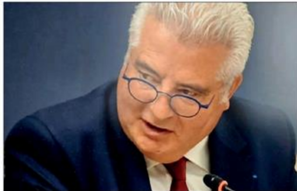
Le sénateur Anglars est rapporteur pour avis dans le projet de loi d'orientation agricole.

De plus, face aux attentes fortes des agriculteurs et aux défis sans précédent tels que la transmission des exploitations, l'installation des jeunes agriculteurs ou encore la compétitivité, le sénateur a proposé plusieurs amendements visant à simplifier les démarches administratives, sécuriser les projets agricoles,