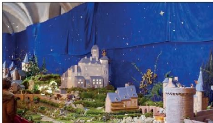
Des paysages et des monuments à découvrir en l'église

Cette 10 e édition où de nombreux bénévoles se sont