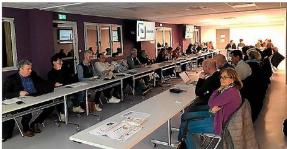
Les élus communautaires en séance.

Le Smictom gère la collecte des déchets, tandis que le traitement est assuré par le Sydom Aveyron. En 2023, 5 666 tonnes de sacs noirs et 2 134 tonnes de sacs jaunes ont été collectées. Les sacs noirs sont transformés en biogaz dans le Tarn, pour produire de l'électricité, tandis que les sacs jaunes sont triés et recyclés à Millau. Les déchetteries ont enregistré 7 352 tonnes de déchets avec 75 369 passages. La collecte du verre a atteint 1 230 tonnes,