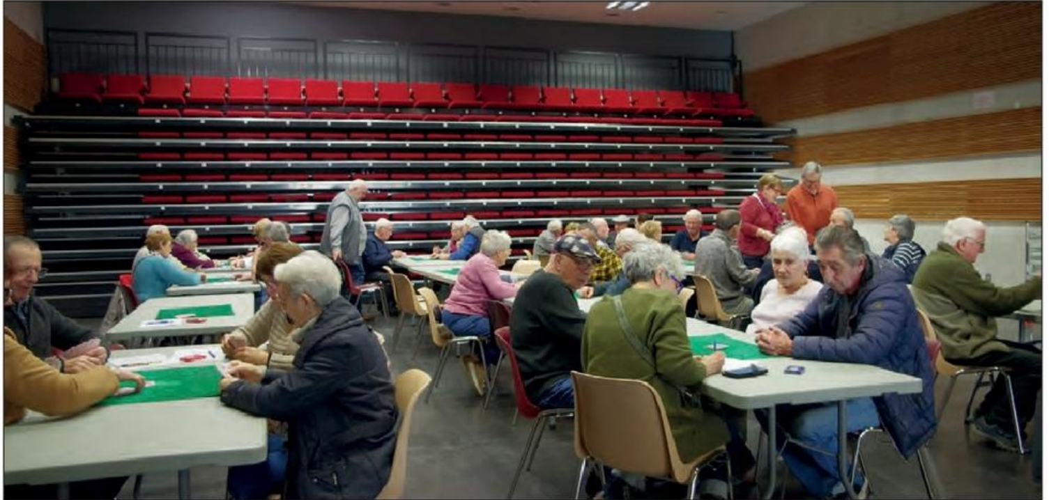
Les parties se succèdent à un bon rythme.

En ce premier dimanche de février, les Musiciens du Nayrac organisaient un concours de belote à l'Espace Multiculturel. Les joueurs étaient accueillis au son des accordéons et des cabrettes avant de s'inscrire et de prendre place autour des tables.