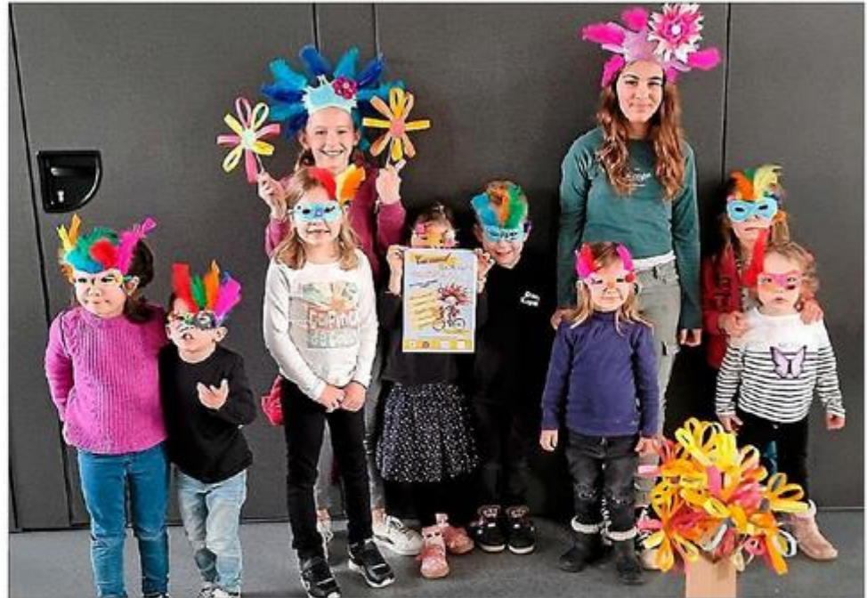
Les enfants ont déjà préparé de jolis masques, hauts en couleurs.

Vers 17 heures, viendra le moment tant attendu de la crémation de Mme Carnaval, un événement symbolique marquant la fin de l'hiver et l'arrivée des beaux jours. Mme Carnaval a été confectionnée avec talent par les enfants des accueils de loisirs d'Espalion, Saint-Côme-d'Olt et