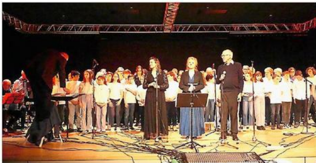
Le final avec « merci Nougaro ».