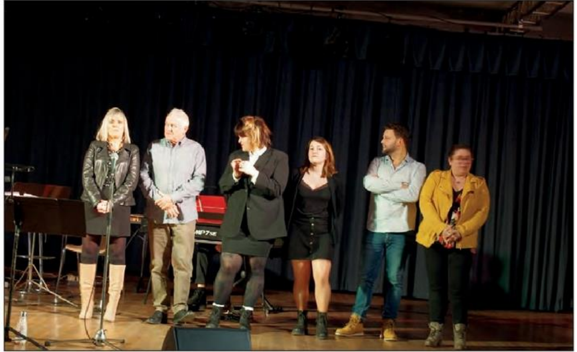
Les concurrents en route vers la finale.