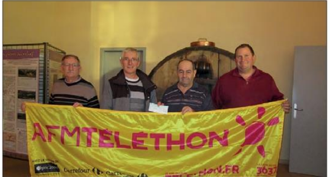
Remise du chèque des Vignerons.

nerons renouvelent chaque année et que l'on remercie chaleureusement.