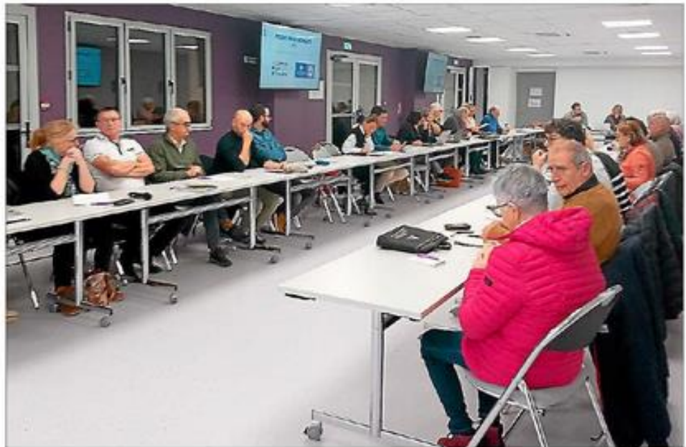
Un conseil studieux.

Le versement d'un acompte de subvention de 100 000 € à l'office de tourisme Terres d'Aveyron a été acté. Le plan de finance-