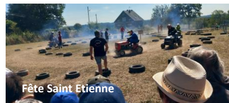
Fête Saint Etienne