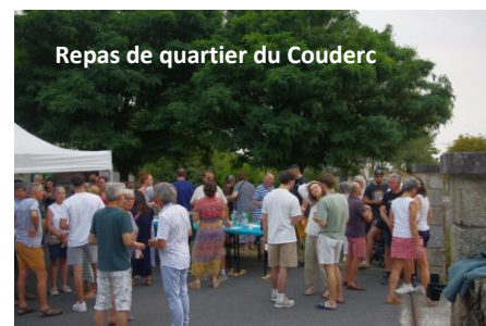
Repas de quartier du Couderc