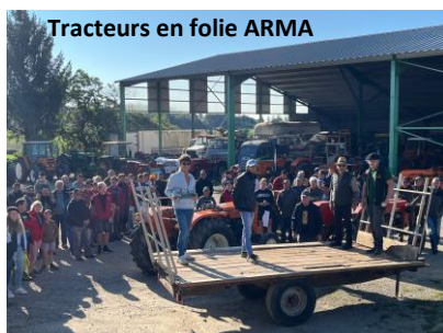
Tracteurs en folie ARMA