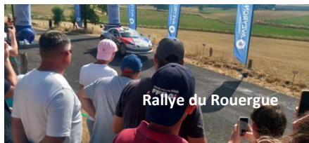
Rallye du Rouergue