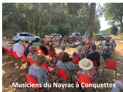
Musiciens du Nayrac à Conquettes