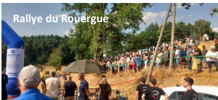
Rallye du Rouergue

Revivez en images les temps forts de cet été 2025, à travers une sélection de photos qui témoignent de l'ambiance festive et chaleureuse qui a animé notre commune.