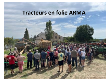
Tracteurs en folie ARMA