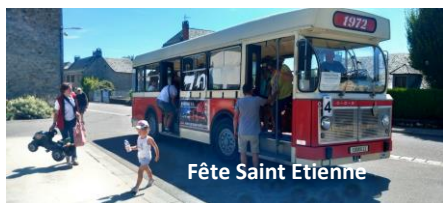
Fête Saint Etienne