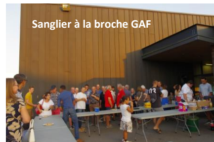
Sanglier à la broche GAF