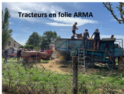
Tracteurs en folie ARMA