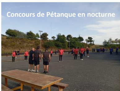
Concours de Pétanque en nocturne