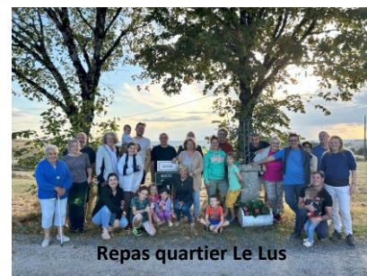
Repas quartier Le Lus