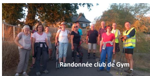
Randonnée club de Gym