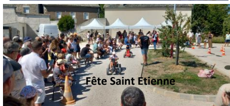
Fête Saint Etienne