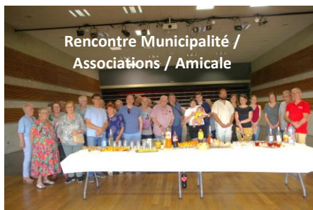
Rencontre Municipalité / Associations / Amicale